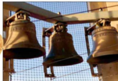
Het Koning Willem-Alexander Carillon bestaat nu nog uit 25 klokken; er staan er nog vijf klaar. Maar voor de montage moet eerst geld voorhanden zijn.